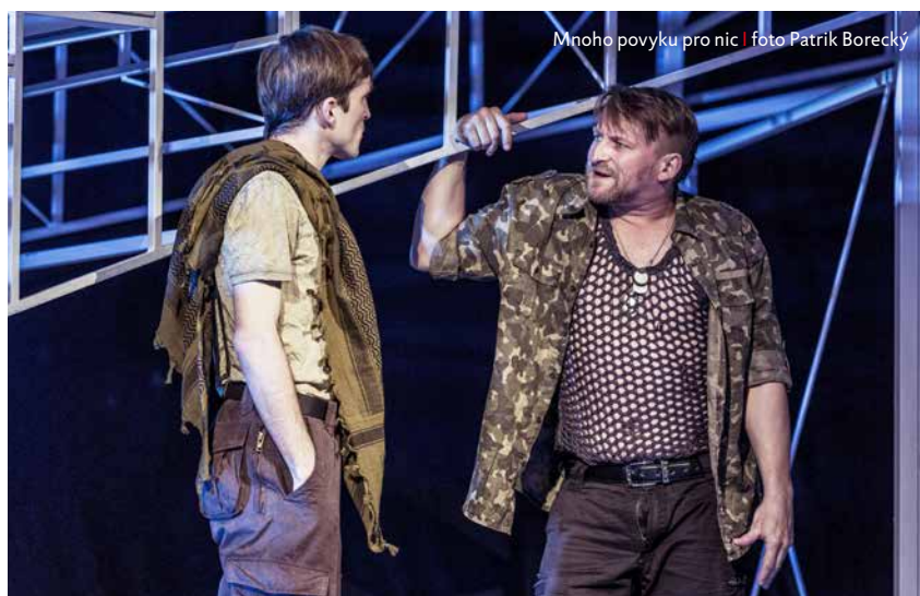
Mnoho povyku pro nic