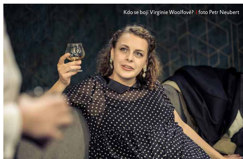
Kdo se bojí Virginie Woolfové?