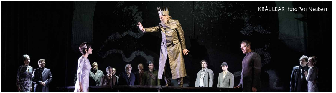
KRÁL LEAR