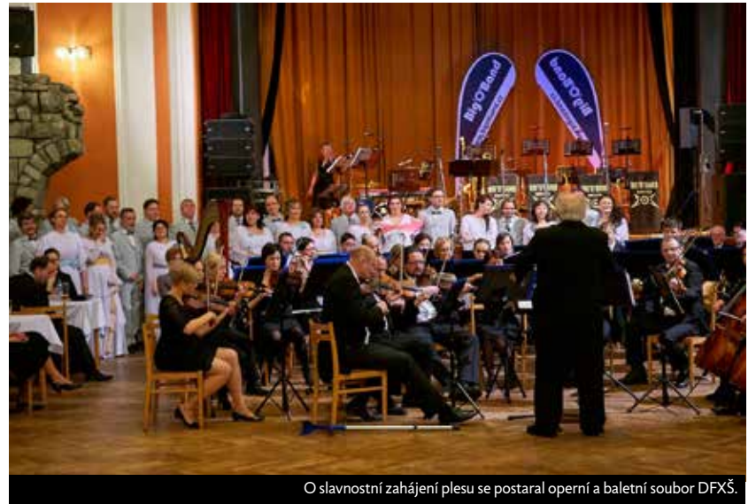
O slavnostní zahájení plesu se postaral operní a baletní soubor DFXŠ.