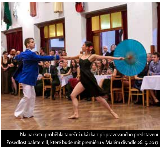
Na parketu proběhla taneční ukáзка z připravovaného představení Posedlost baletem II, které bude mít premiéru v Malém divadle 26. 5. 2017