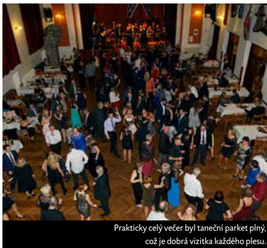
Prakticky celý večer byl taneční parket plný, což je dobrá vizička každého plesu.