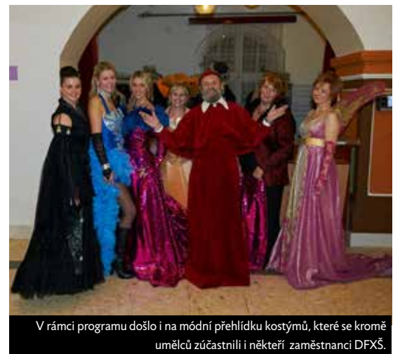
V rámci programu došlo i na módní přehlídce kostýmů, které se kromě umělců zúčastnili i někteří zaměstnanci DFXŠ.