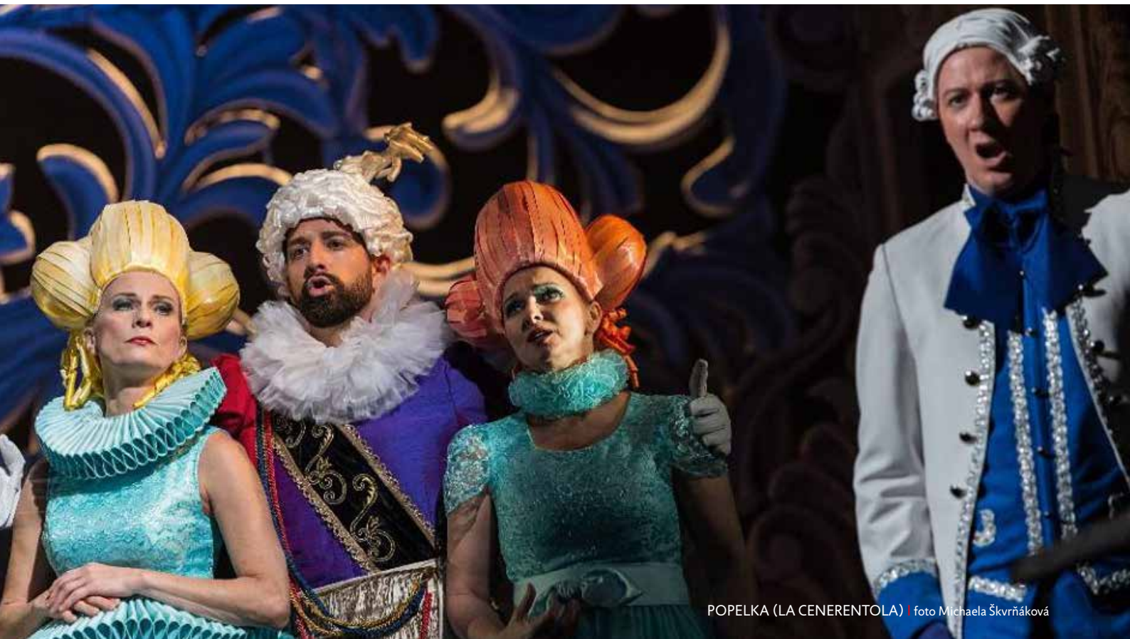
POPELKA (LA CENERENTOLA)