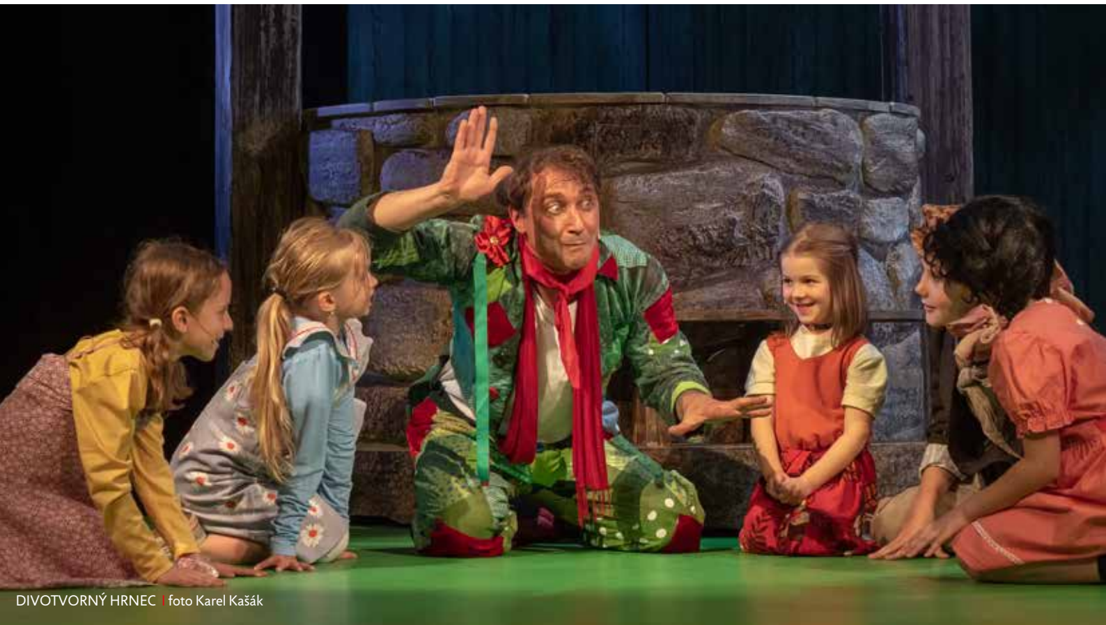
DIVOTVORNÝ HRNEC