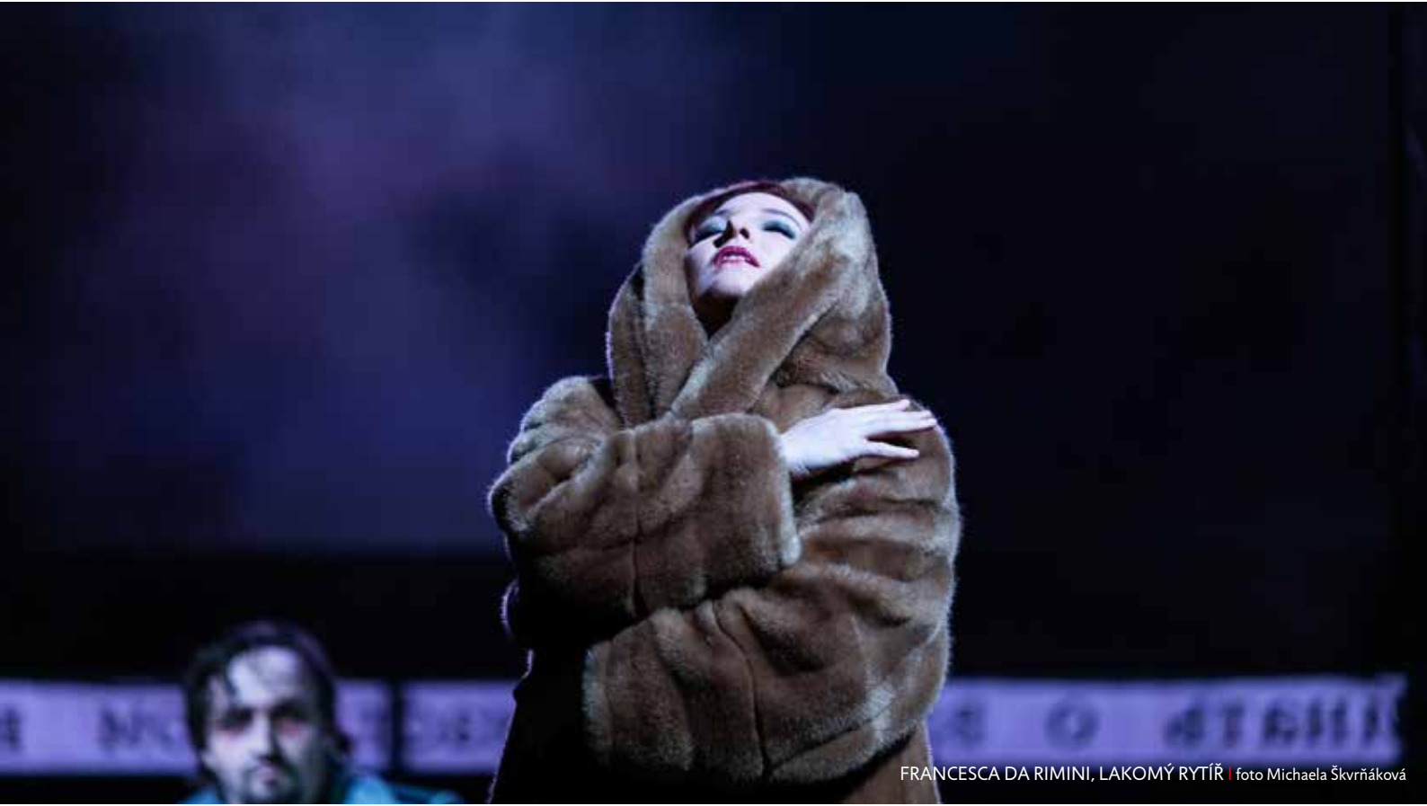
FRANCESCA DA RIMINI, LAKOMÝ RYTÍŘ