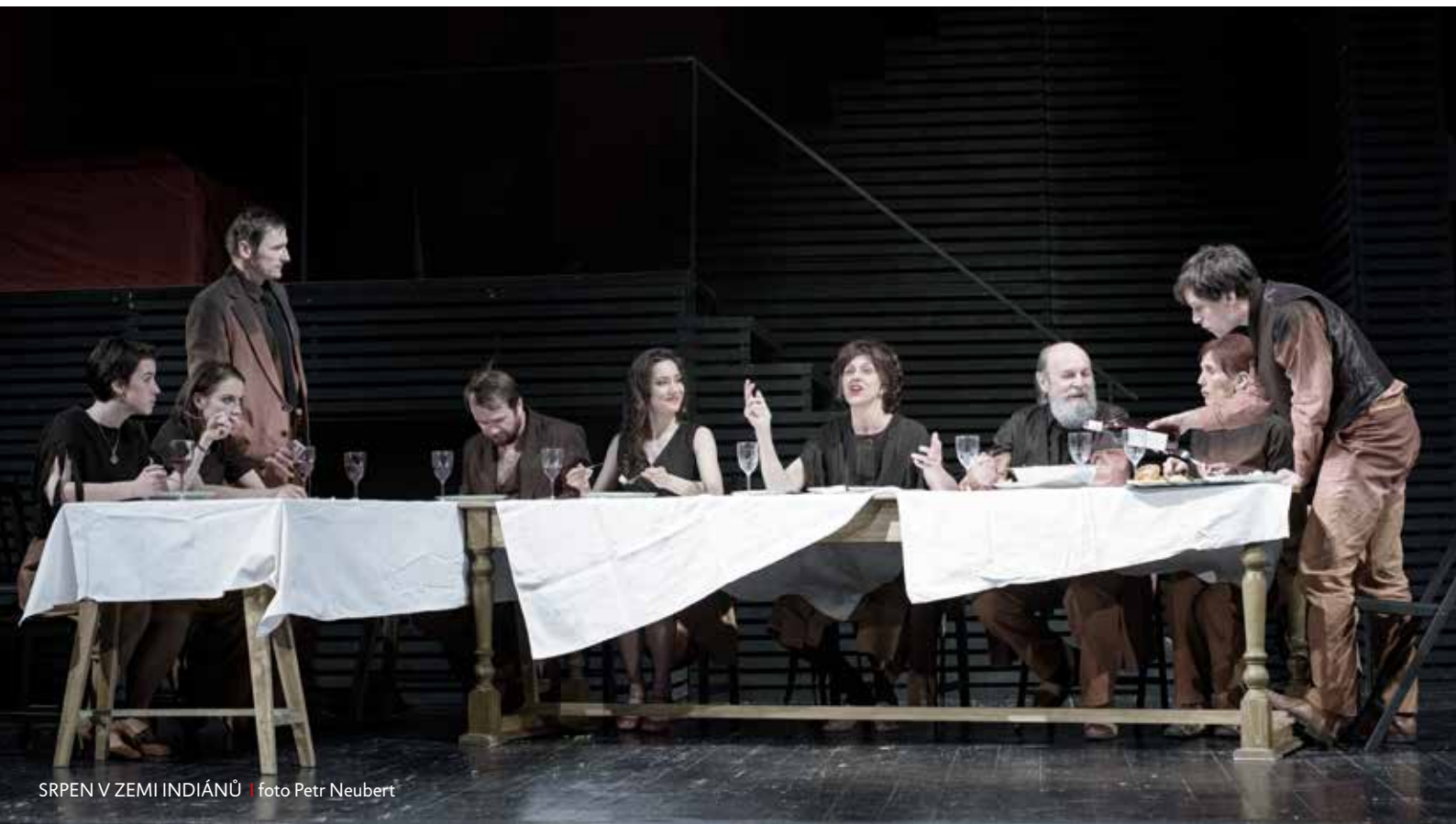
SRPEN V ZEMI INDIÁNŮ