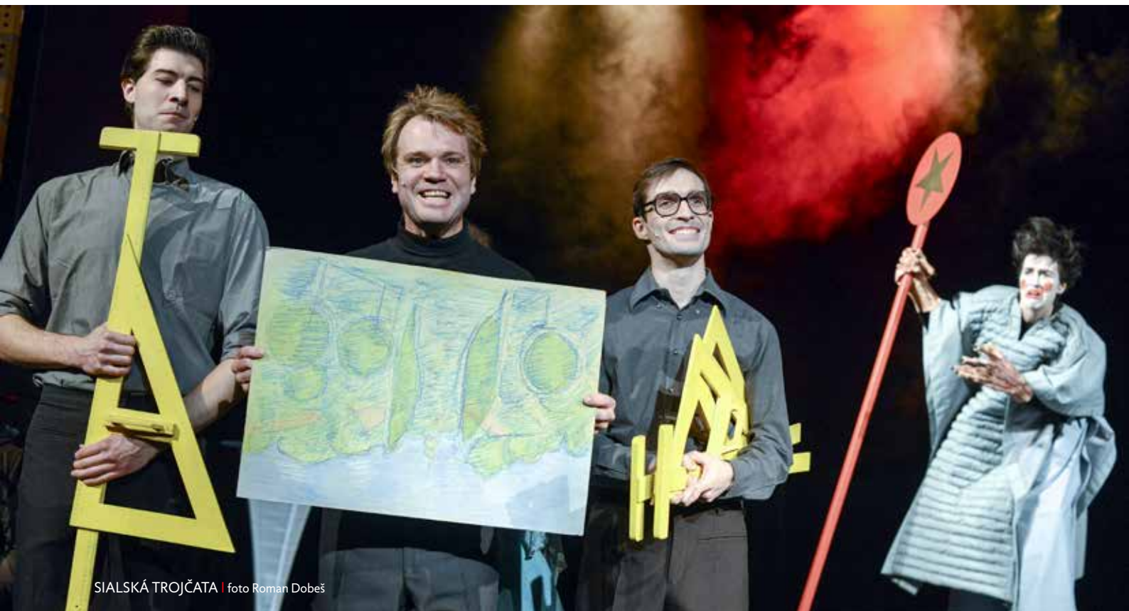
SIALSKÁ TROJČATA