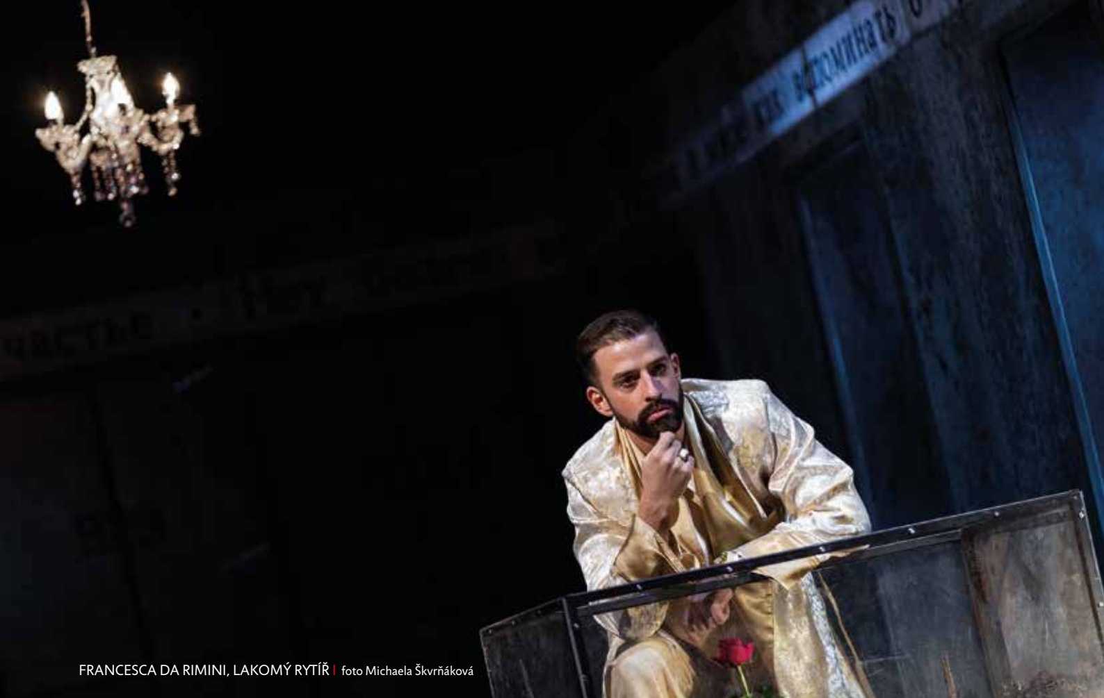
FRANCESCA DA RIMINI, LAKOMÝ RYTÍŘ