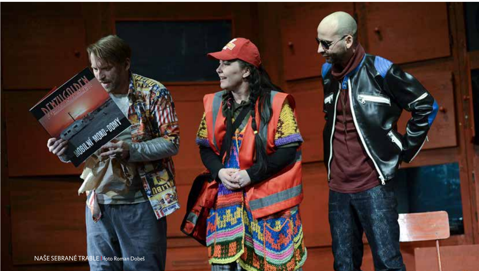
NAŠE SEBRANÉ TRABLE