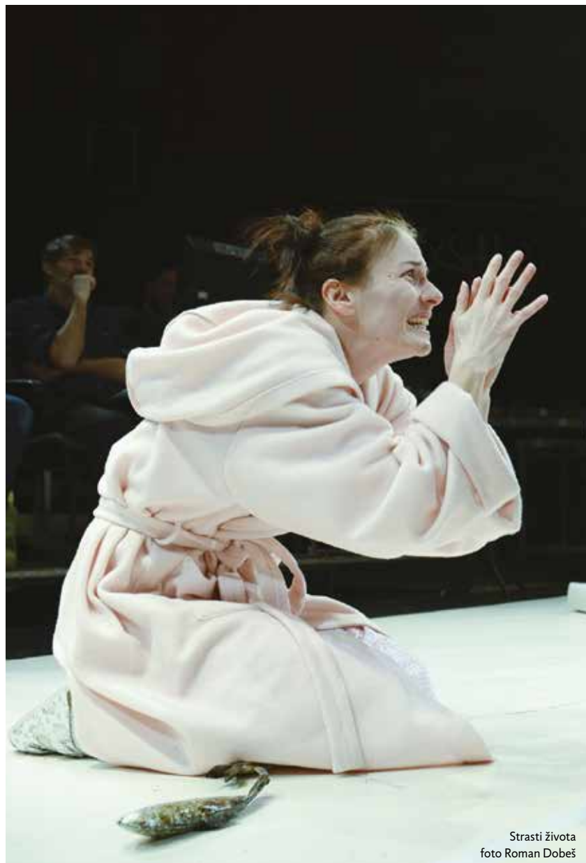
Strasti života