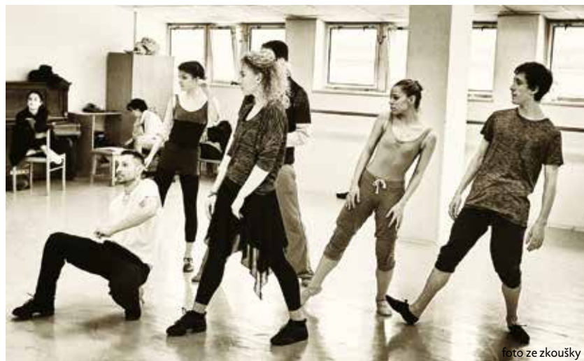
foto ze zkoušky

Další reprízu si nenechte ujít hned následující den – 14. května.