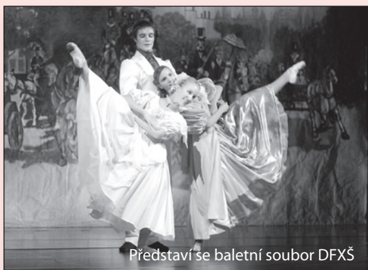
Představí se baletní soubor DFXŠ

Život se ubírá klikatými cestičkami, a tak i když jsme jako podzimní baletní premiéru slibovali Marii Anoinetu, nenadálé okolnosti nás přinutily tento balet odsunout o pár měsíců dál. Taneční dílo o francouzské pannovnici uvidíte jako první baletní premiéru roku 2009. Na jeho místo nasazujeme titul, který vás jistě pobaví – komický balet Marná opatrnost aneb Špatně hlídaná dcera.