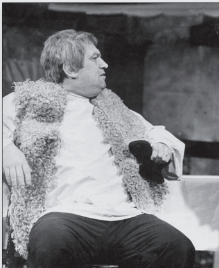
Z inscenace Besedy pod jasnou lunou (1978)