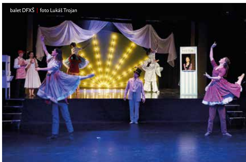
balet DFXŠ | foto Lukáš Trojan