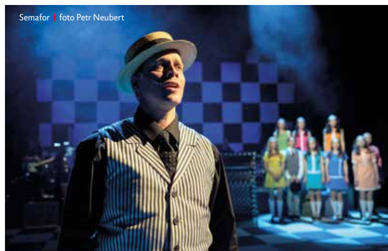
Semafor | foto Petr Neubert