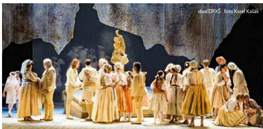
sbor DFXŠ