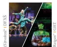
„Sjvoiten“ i DFXŠ

Ahoj sousede. Hallo Nachbar. Interreg V A / 2014 – 2020