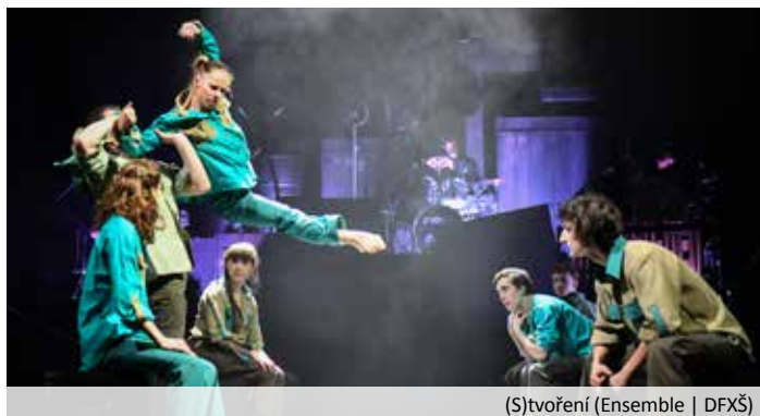
(S)tvoření (Ensemble | DFXŠ)