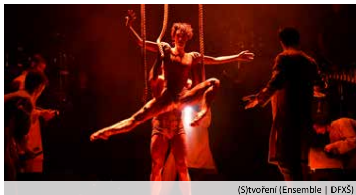
(S)tvoření (Ensemble | DFXŠ)