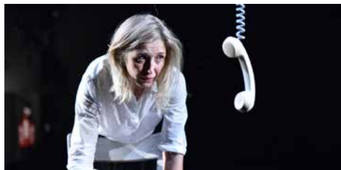
„Die menschliche Stimme“ (Slovensko narodno gledališče Nova Gorica)