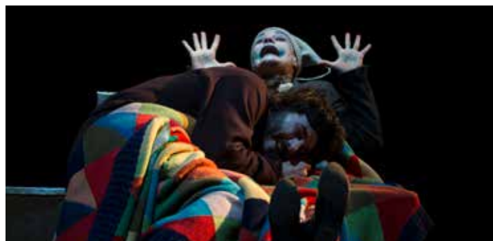
„Malamore“ (Teatro Libero Milano)