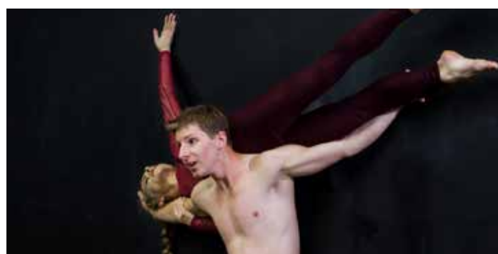
„RZECZY-THINGS-DINGE“ (Psychoteatr Wrocław)

Internet: www.g-h-t.de/de/J-O-S-Festival | Všechny termíny na str. 12.