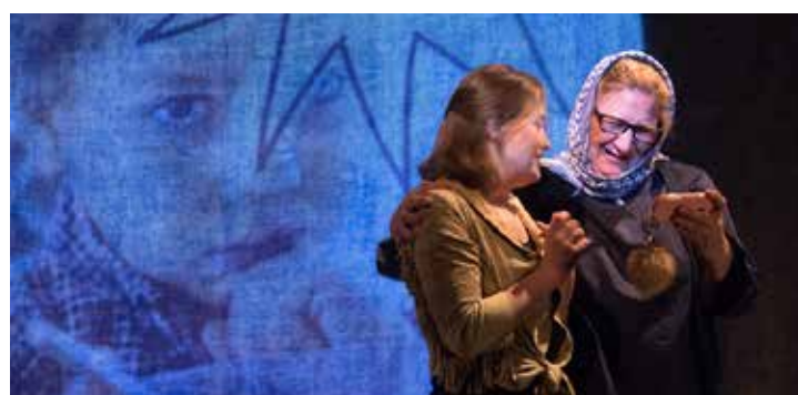
„JUM'AH. Eine arabische Nacht“ (Lubuski Teatr im. L. Kruczkowskiego in Zielonej Górze)

Infos unter: www.g-h-t.de/de/J-O-S-Festival | Alle Termine auf Seite 12.