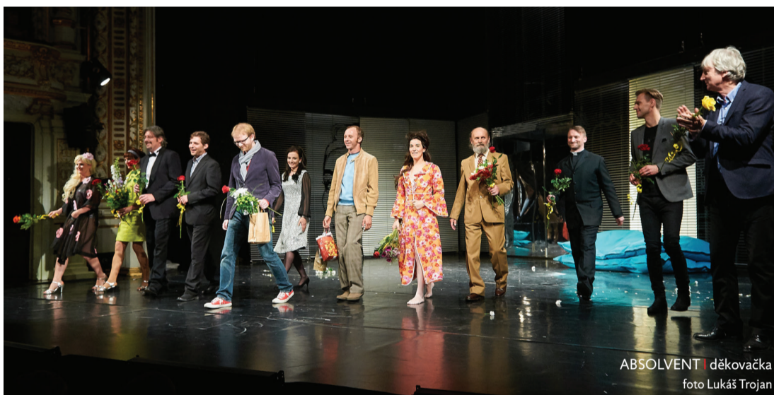
ABSOLVENT | děkovačka

„Jste nepřítelivější ze všech přítelkyň mých rodičů,“ tak zní jedna z nejděčnějších replik nové komedie na repertoáru DFXŠ. Úspěch inscenací jde těžko srovnávat, ale jisté je, že Absolvent navázal na zdařilé komedie z poslední doby – Školu žen či Poprask na laguně.