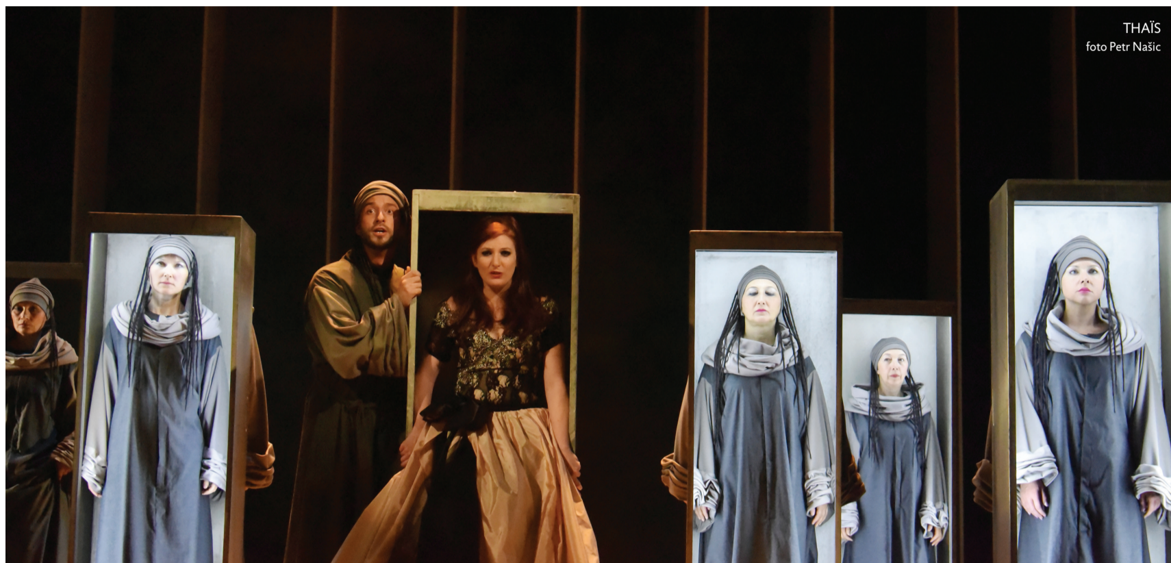
THAÏS foto Petr Našic