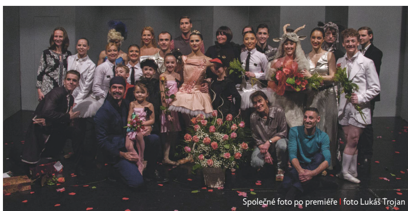
Společné foto po premiéře