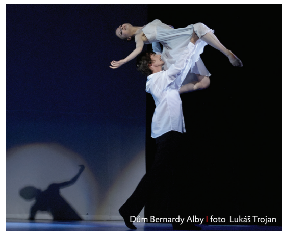
Dům Bernardy Alby

Dům Bernardy Alby: open air 23. června od 20.30 hodin na náměstí Dr. E. Beneše.