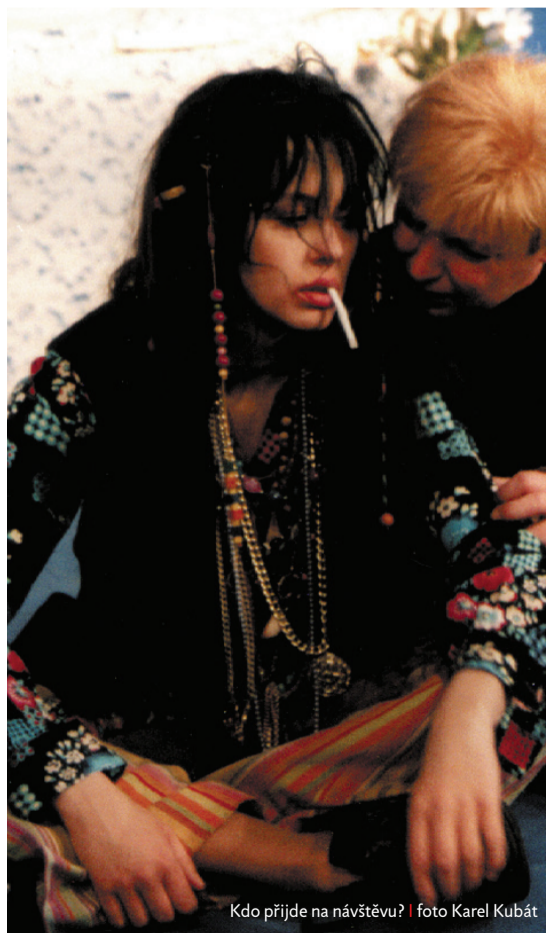
Kdo přijde na návštěvu?

Lola byla výjimečná tím, že jsme byli na jevišti jen tři a já odzpívala v tahu dvacet písniček. A tak jsem říkala, že ta Thálie byla spíš za výdrž. Měla jsem tu inscenaci moc ráda.