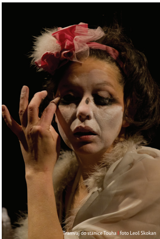
Tramvaj do stanice Touha