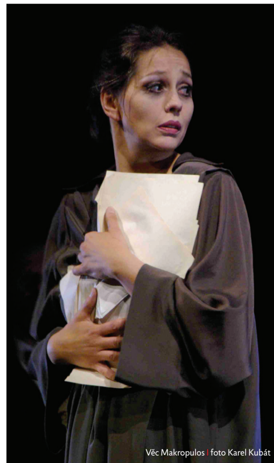
Věc Makropulos