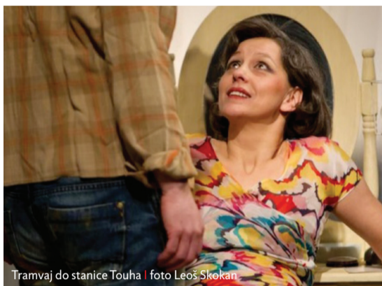
Tramvaj do stanice Touha

Já se stěhuju pořád dál a dál od lidí. Nejkrásněji mi je v lese v Jizerkách. Ale to myslím spouště lidí, herečky v tomhle ohledu nejsou nijak výjimečné. Jen jsem trochu žena dvou tváří. Když vyjízdim od nás z rokle do divadla, tak musím dávat pozor, aby mi nekoukala sláma z bot. A to nemyslím nijak obrazně.