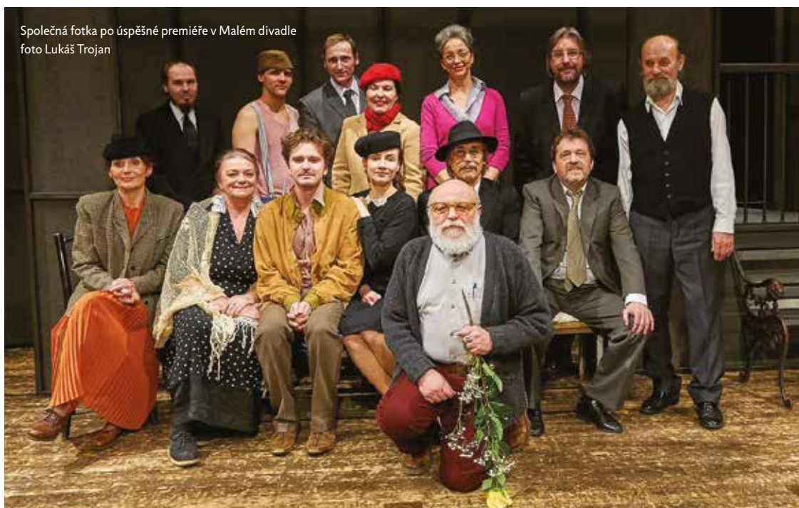
Společná fotka po úspěšné premiéře v Malém divadle