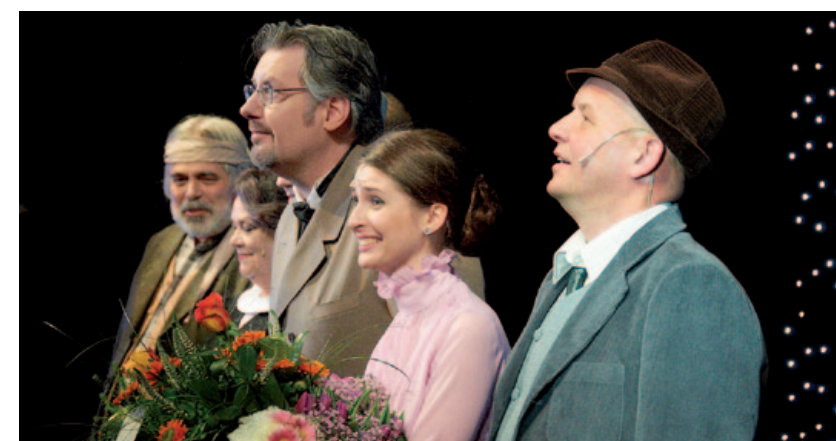
děkovačka po premiéře