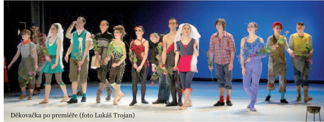
Děkovka po premiéře