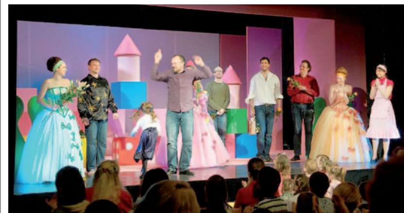
děkovačka po premiéře