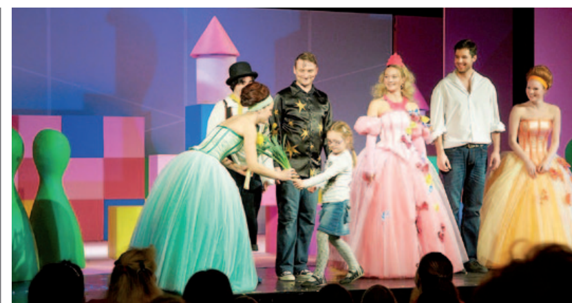
děkovačka po premiéře