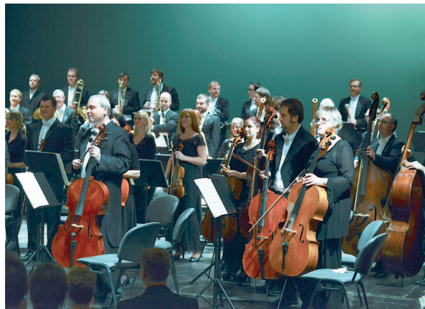
Orchestr DFXŠ