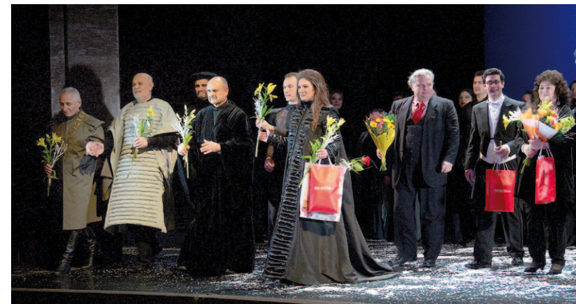
děkovačka po premiéře