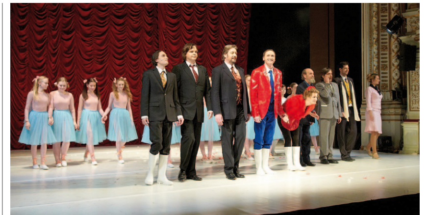
děkovačka po premiéře

DĚJINY STRANY MÍRNÉHO POKROKU V MEZÍCH ZÁKONA