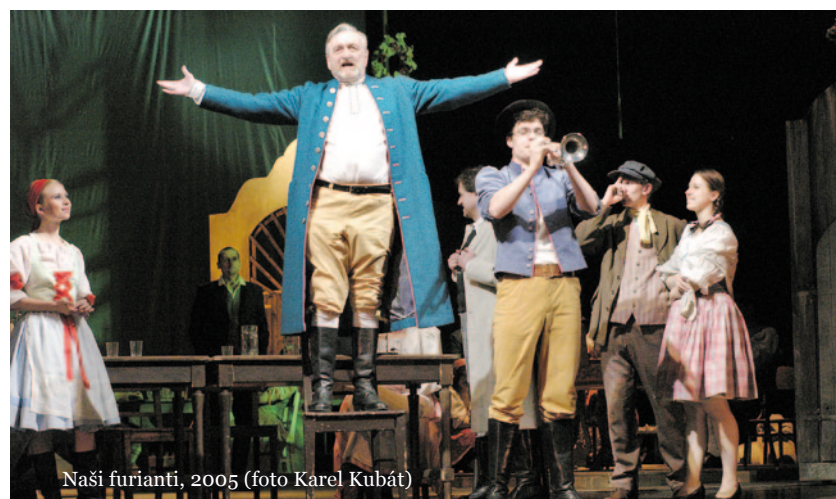
Naši furianté, 2005