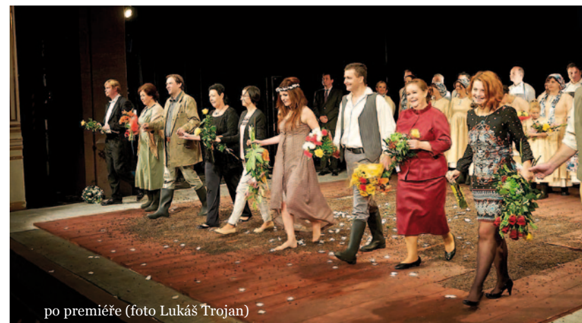
po premiéře