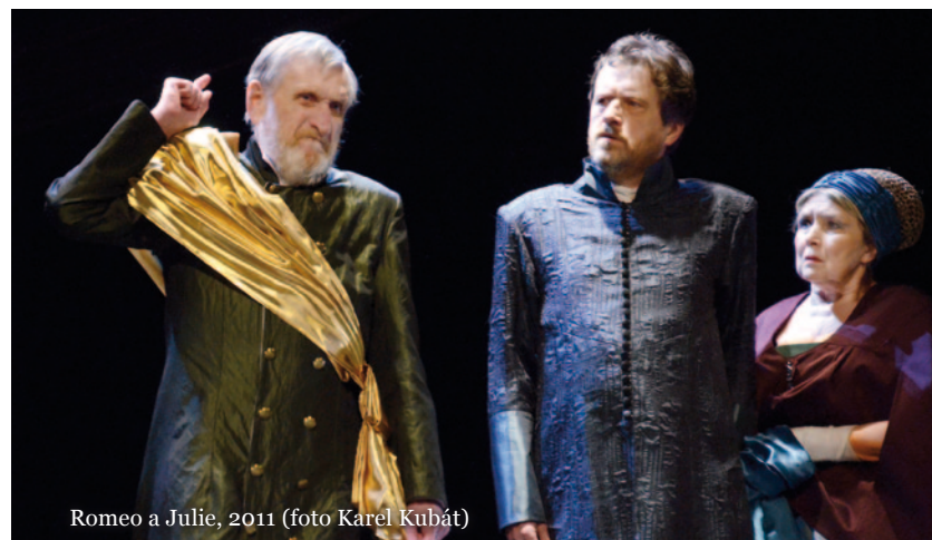
Romeo a Julie, 2011