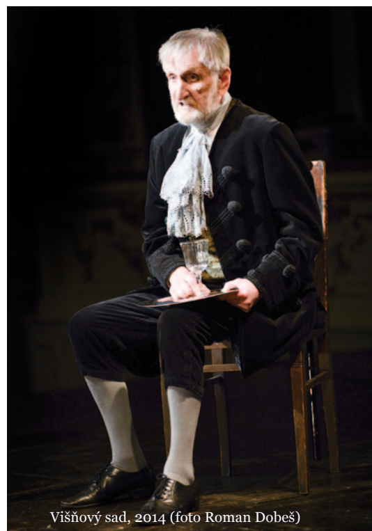
Višňový sad, 2014