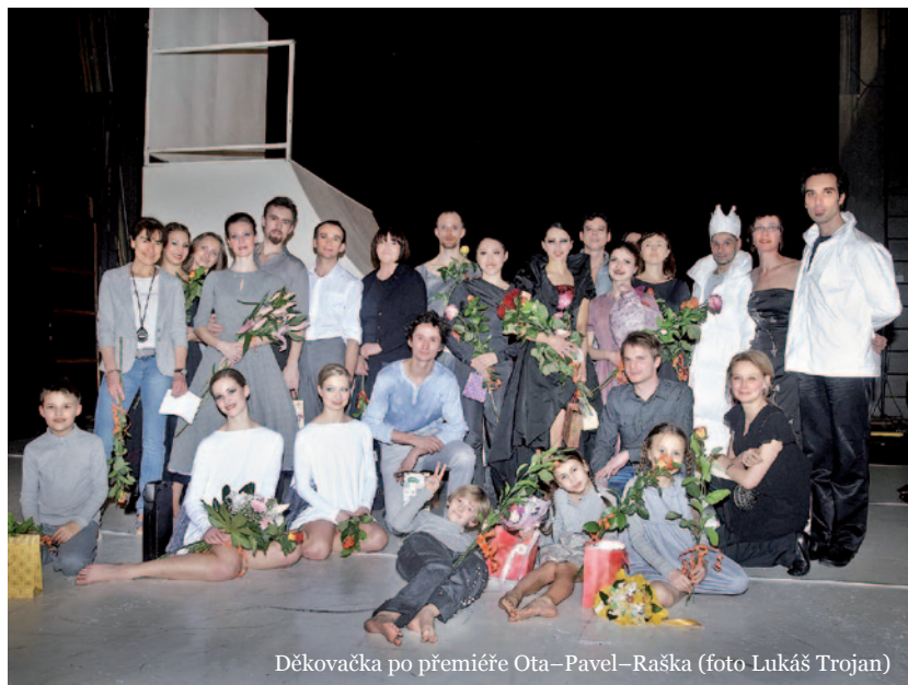
Děkovačka po premiéře Ota–Pavel–Raška