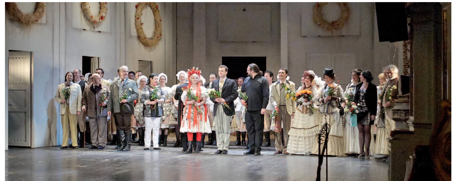
Děkovačka po premiéře