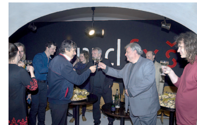
Popremiérový přípitek v klubu Malého divadla