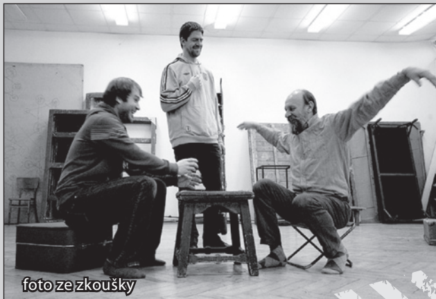
foto ze zkoušky

Kdo komu vládne? Shakespeare byl genderově nekorektní a povrchní, pozorovatelé by mu přisoudili roli machistického spisovatele, který nesmí feministkám na oči. Leč tyto kategorie v jeho případě neplatí. Jasně, že byl zcela v zakletí dobového chápání role ženy ve společnosti. Ale jako ke všem tématům své doby zaujal zcela neobvyklý postoj i v tomto případě, daný tím, jak chápal svou profesi autora her, herce a režiséra. Totiž žádná role ve společnosti není nezpochybnitelná a má dvě opačné a ambivalentní stránky. A tak v jeho komedii nájemný zchudlý a drsný křupan Petruccio za slib věna, tučného věna a odměn od přátel ujme se úlohy muže, který si vezme hubatou, razantní a zvyklostem se vzpouzející divokou Kateřinu. Za peníze by se oženil třeba s koštětem. Slíbí z ní udělat hodnou a poslušnou kočičku, oddanou a přívětivou manželku, která poslušností předčí všechny os-